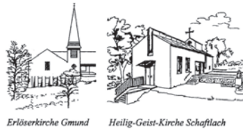
Erlöserkirche Gmund Heilig-Geist-Kirche Schaftlach

Evangelisch-Lutherische Kirchengemeinde 83703 Gmund a. Tegernsee Kirchenweg 15 E-Mail: pfarramt.gmund@elkb.de