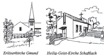
Erlöserkirche Gmund Heilig-Geist-Kirche Schaftlach