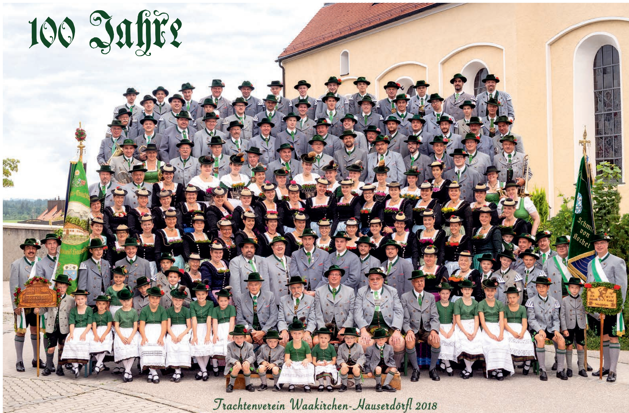
Trachtenverein Waakirchen-Hauserdörfel 2018