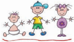
Erika-Sixt-Kindertagesstätte im Haus für Kinder Schaftlach