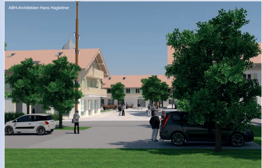
Der neue Dorfplatz von Süden (Visualisierung)