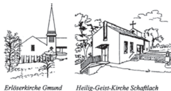
Erlöserkirche Gmund Heilig-Geist-Kirche Schaftlach

Evangelisch-Lutherische Kirchengemeinde 83703 Gmund a. Tegernsee Kirchenweg 15 E-Mail: pfarramt.gmund@elkb.de